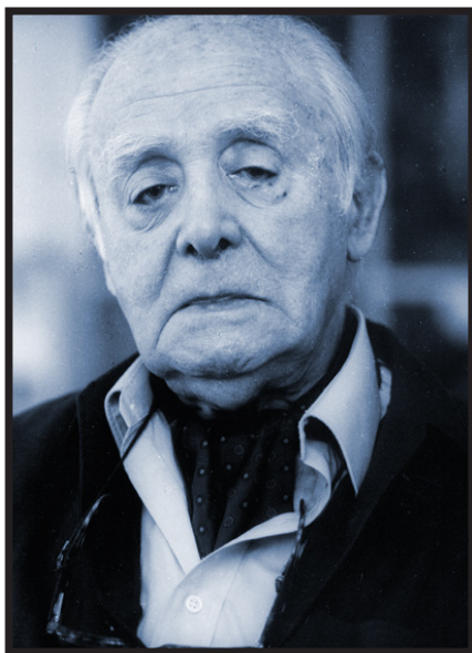
Jerzy Giedroyc (1906-2000) w 110. rocznicę urodzin