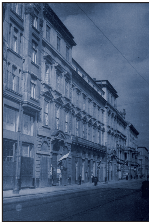
Institut Wschodni w Warszawie (1926-1939) w 90. rocznicę powstania

SZÓSTĄ Z CYKLU DOROCZNYCH SESJI PROMETEJSKICH STUDIUM EUROPY WSCHODNIEJ